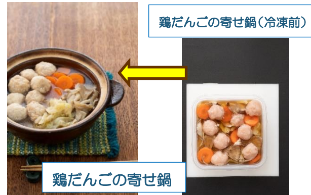
鶏だんごの寄せ鍋(冷凍前)